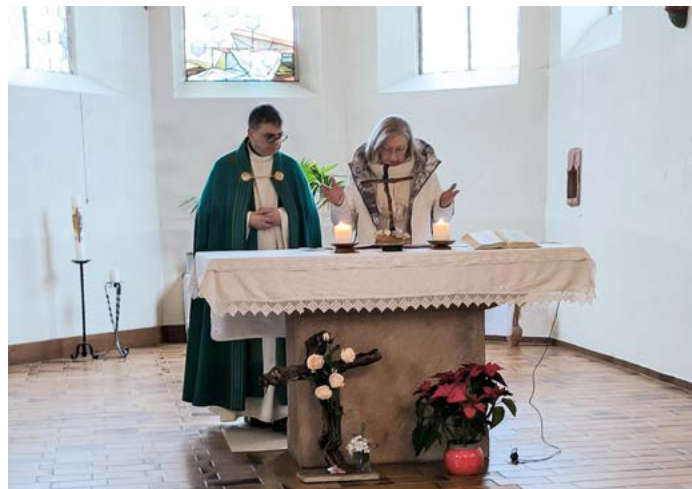
Célébration œcuménique du 25 janvier 2026.