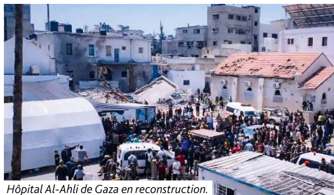
Hôpital Al-Ahli de Gaza en reconstruction.